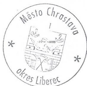
Zita V á c l a v í k o v á místostarostka